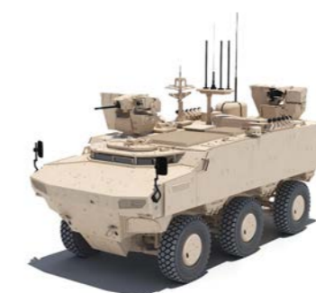
PARS IV 6x6 Tim Aracı 2 x SANCAK UKK