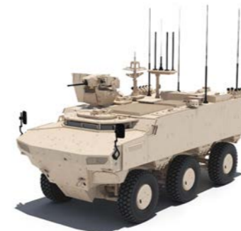
PARS IV 6x6 Komuta Kontrol ve Muharebe Aracı SANCAK UKK

Araç, muharebe etkinliği, konum ve yön tayini, komuta / kontrol ve hızlı hedeflemeyi sağlayan yeni nesil görev ekipmanları ile donatılmıştır.