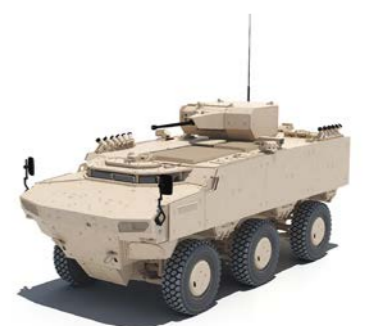
PARS IV 6x6 Ateş Destek Aracı 25 mm SABER UKK