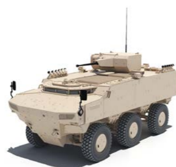
PARS IV 6x6 Vehículo de Apoyo de Fuego 25 mm SABER RCT