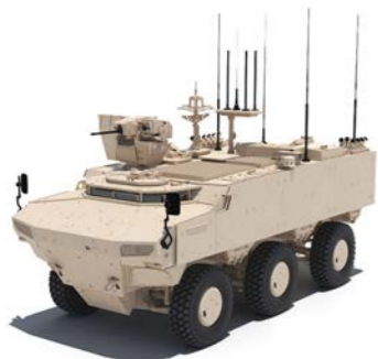
PARS IV 6x6 Vehículo de Mando, Control y Señales SANCAK RWS

El vehículo está equipado con equipos de misión de nueva generación que garantizan la efectividad en el combate, la planificación de rutas más seguras, el comando/control y la orientación rápida.