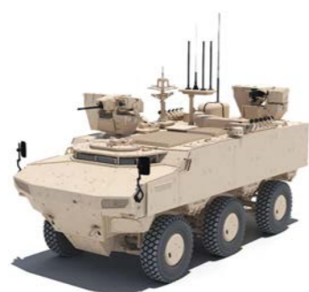
PARS IV 6x6 Transporte de Personal 2 x SANCAK RWS